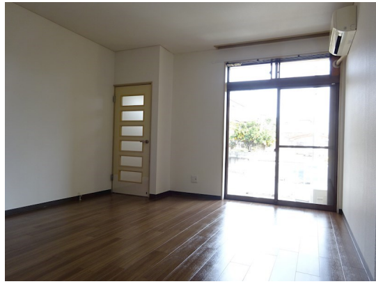
図面と現況が異なる場合は現況が優先となります。